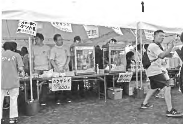
カツサンド/ポップコーン