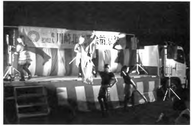
ウルトラヴァイオレット