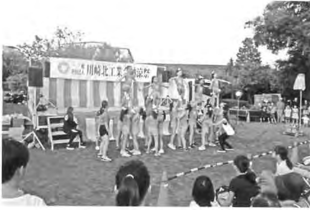
『チアダンス』アリーズ