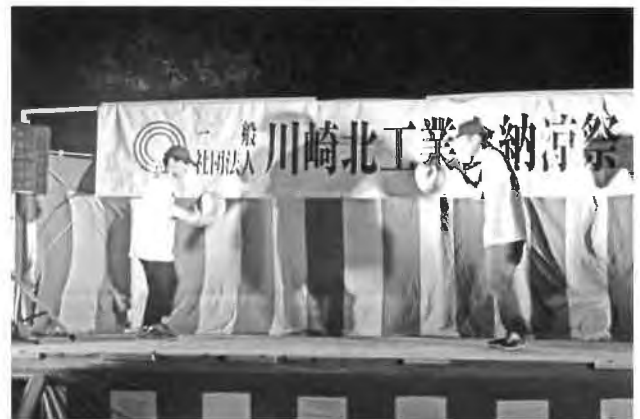
From Red Ground