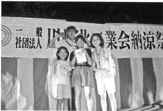
抽選当たって嬉しい笑顔!