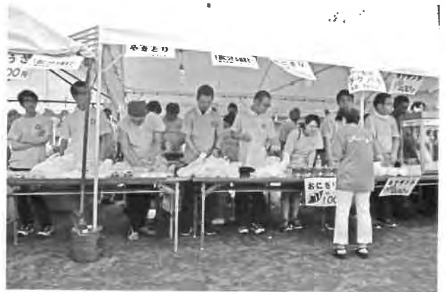
やきとり/おにぎり