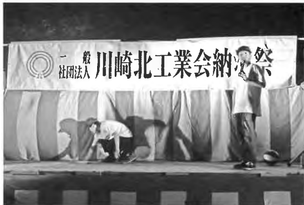
『フリースタイルバスケットボール』