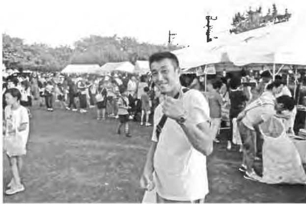
今年度のイケメン青年部長!!