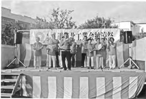
久地いきいきクラブの皆さんのコーラス