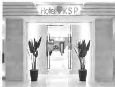
ホテルエントランス