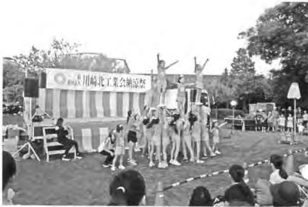
毎年素晴らしい演技ありがとう!