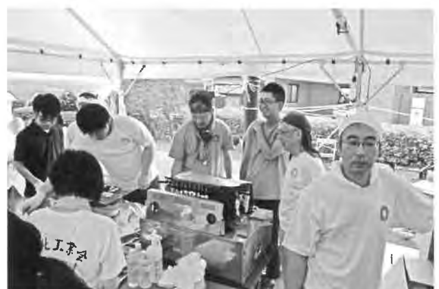
毎年やきとり参加ヒロキ産業(株)さん