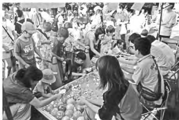
スーパーボール/ヨーヨー