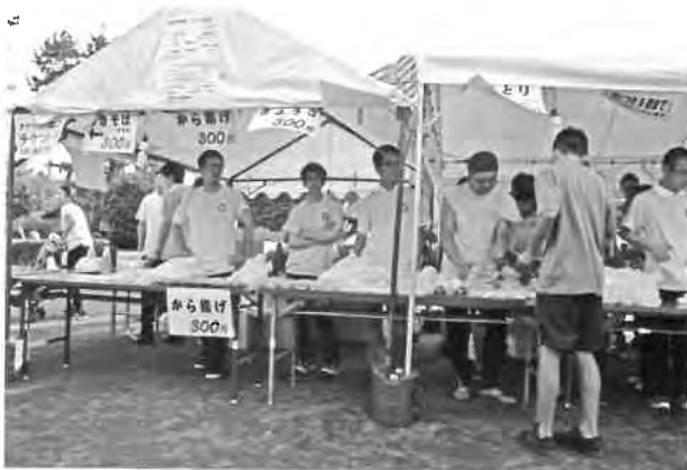
焼きそば/から揚げ/ぎょうざ