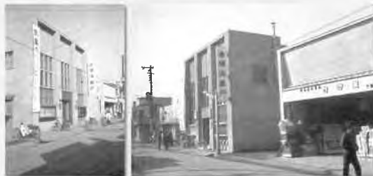
当時は大山街道沿いがありました。