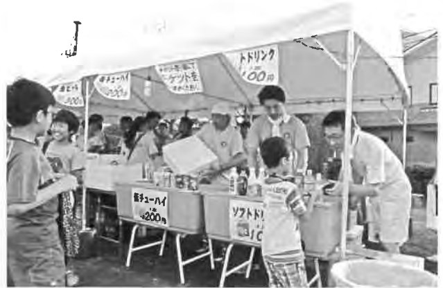
チューハイ/ソフトドリンク