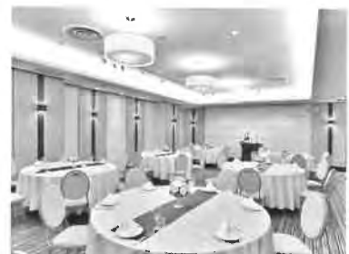
バンケットルーム 銀座