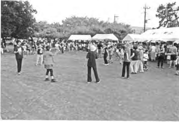
皆さん体をほぐしましょう!