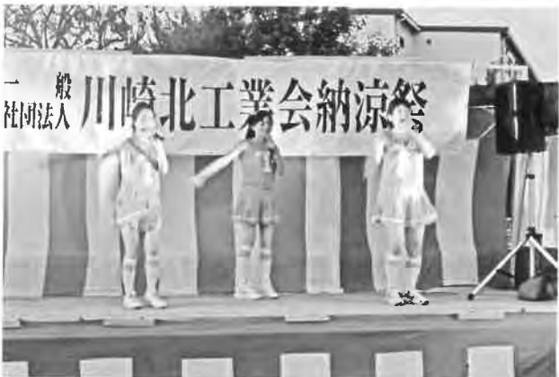
『歌とダンス』虹色ドリーム