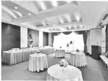
バンケットルーム 栢