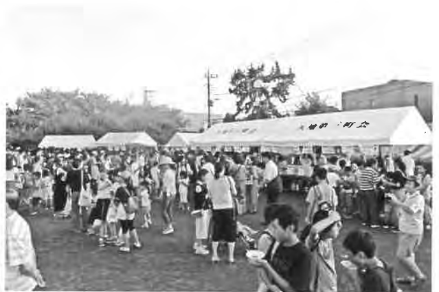
会場は賑わってきました