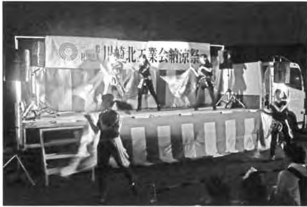
『バトンドリルステージ』