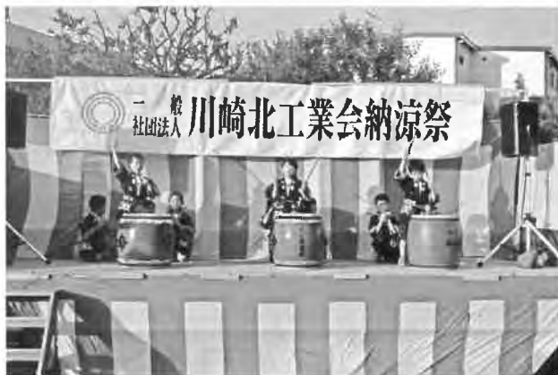
くじ保育園 年長組