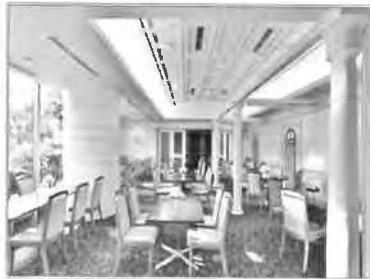
レストラン ガーディナ