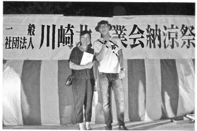
抽選当たって嬉しい笑顔!