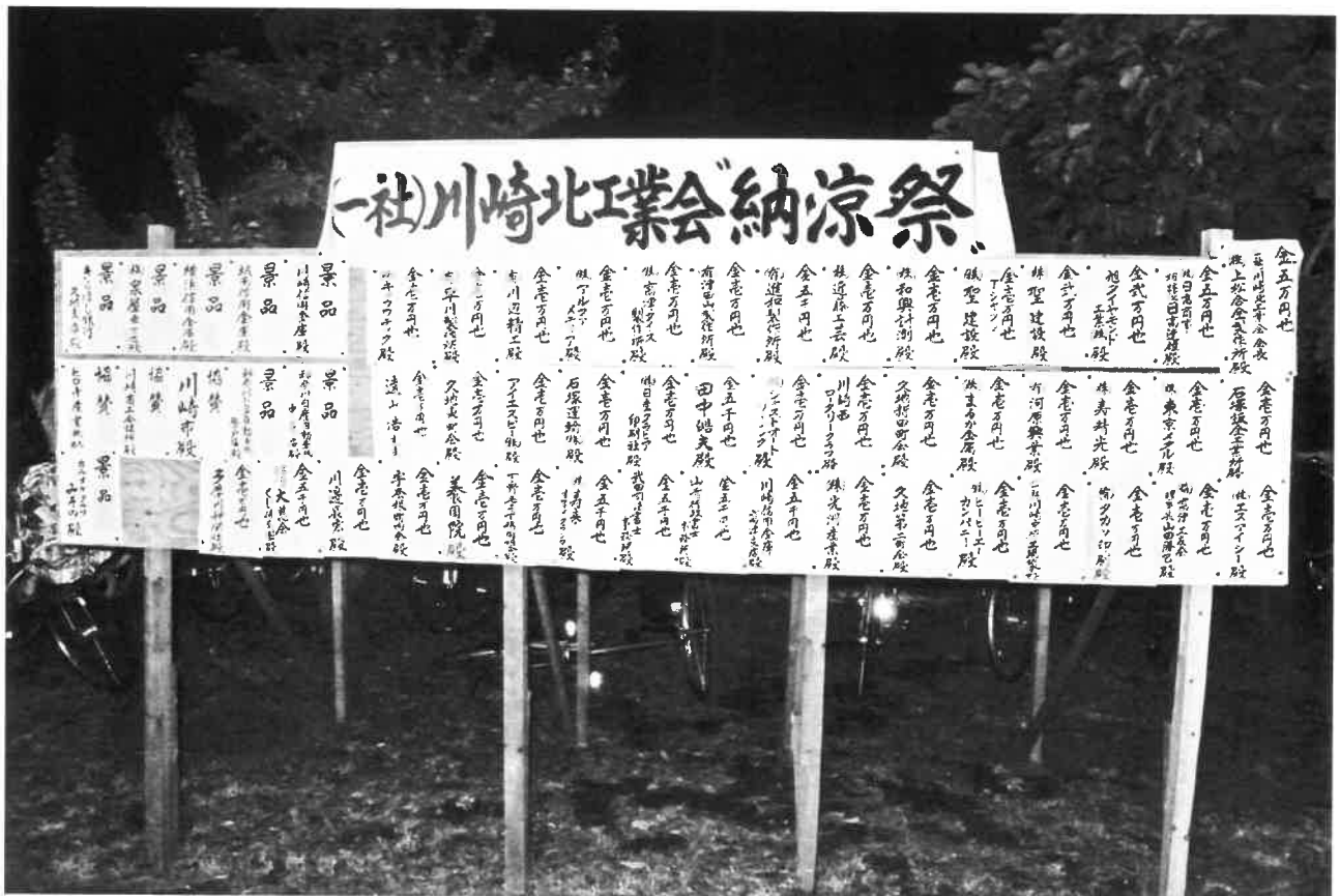
たくさんのお祝い金、景品ご寄付等 ご協力頂きまして誠に有り難うございました