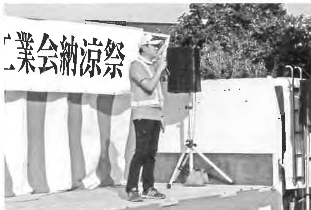
堀越実行委員長挨拶