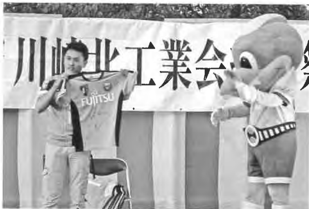
ふろん太君とジャンケン勝って サイン入りユニフォームをゲット!