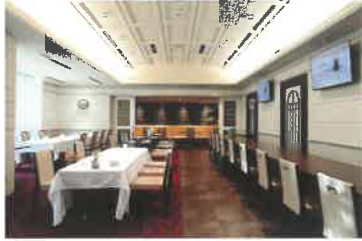
All Day Dining 「グランキッチン」