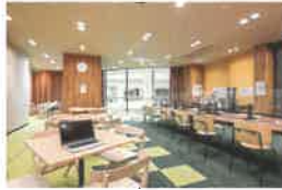
コワーキング&シェアオフィス 「Tech-Pot」