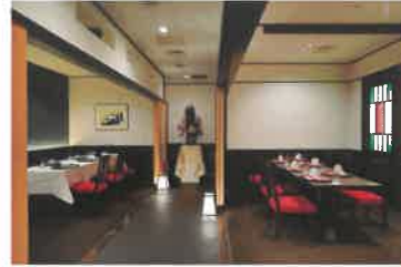
Private Dining 「TAMAGAWA・NOGAWA」