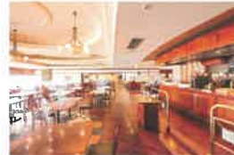
カフェテリアレストラン 「ウィズアスマイル」