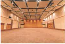
多目的ホール 「KSP ホール」