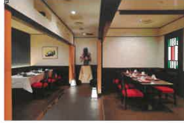
Private Dining 「TAMAGAWA・NOGAWA」