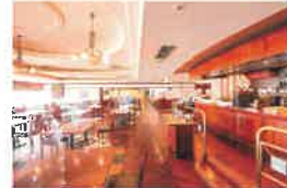
カフェテリアレストラン「ウィズアスマイル」