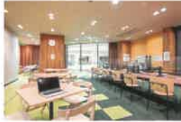
コワーキング&シェアオフィス「Tech+Pot」