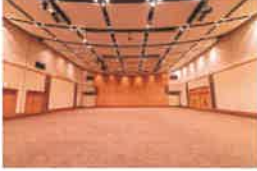
多目的ホール 「KSPホール」