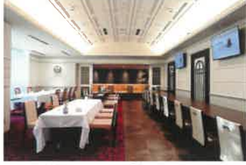
All Day Dining 「グランキッチン」