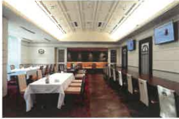
All Day Dining 「グランキッチン」