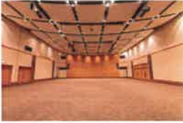
多目的ホール 「KSPホール」