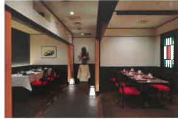
Private Dining 「TAMAGAWA・NOGAWA」