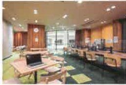
コワーキング&シェアオフィス「Tech-Pot」