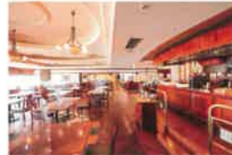
カフェテリアレストラン「ウィズアスマイル」