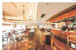
カフェテリアレストラン「ウィズアスマイル」