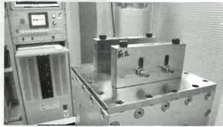
NAS3350に準じた振動試験 振動数 1,780rpm 加振ストローク 11mm インパクト ストローク 19mm