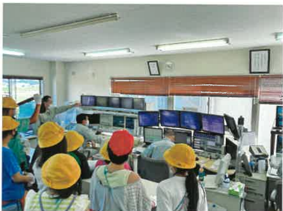
溝口瀬谷レミコン(株)