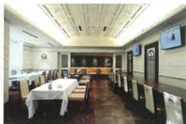
All Day Dining 「グランキッチン」