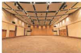
多目的ホール 「KSP ホール」