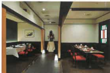
Private Dining 「TAMAGAWA・NOGAWA」