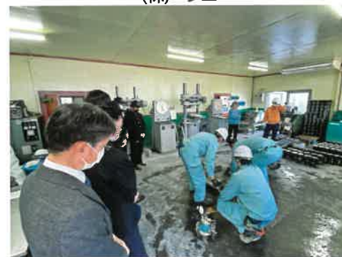
神奈川秩父レミコン(株)