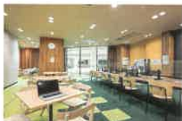
コワーキング&シェアオフィス「Tech-Pot」