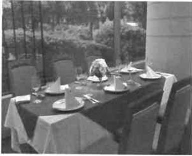
レストラン「ガーディナ」