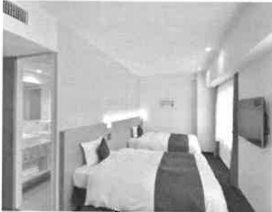
2018年 全室リニューアル