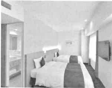
2018年 全室リニューアル