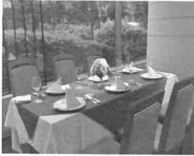
レストラン「ガーディナ」