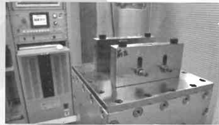
NAS3350に準じた振動試験 振動数 1,780rpm 加振ストローク 11mm インパクト ストローク 19mm