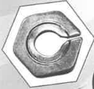
TYPE A 締結例