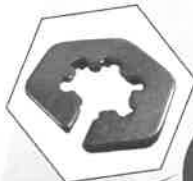
TYPE C 締結例