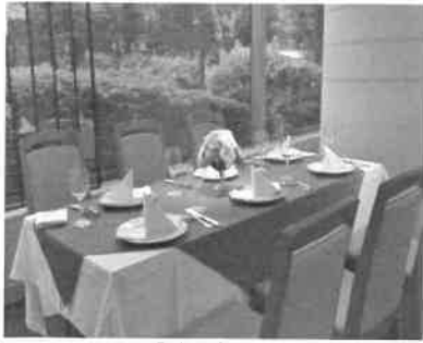
レストラン「ガーディナ」