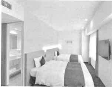
2018年 全室リニューアル